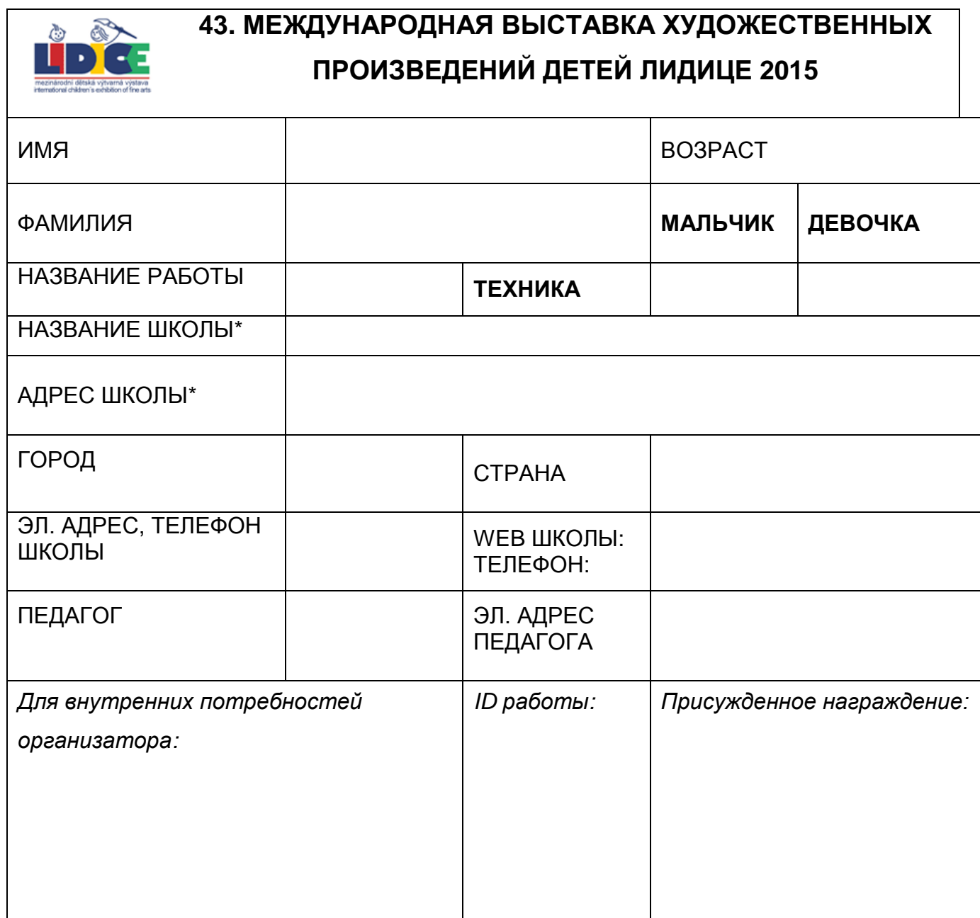
Таблица для маркировки работ

Таблицу прикрепляйте на обратной стороне работы в правом нижнем углу